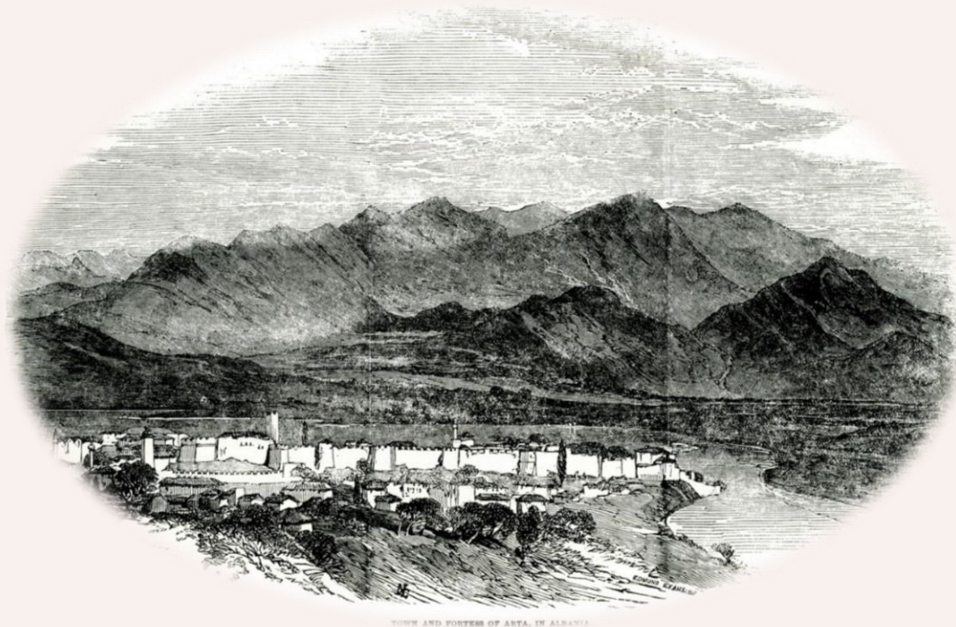
Η πόλη και το Κάστρο της Άρτας. Illustration for The Illustrated London News, 15 April 1854

1854, που διήρκησε μόλις λίγους μήνες, ο πληθυσμός της Άρτας υφίσταται μεταβολές, σύμφωνα με τις εκθέσεις του αυστριακού προξενείου στα Γιάννενα, ιδιαίτερα όσον αφορά τις τουρκικές δυνάμεις στην πόλη και τις αυξομειώσεις του μόνιμου τμήματος του πληθυσμού.