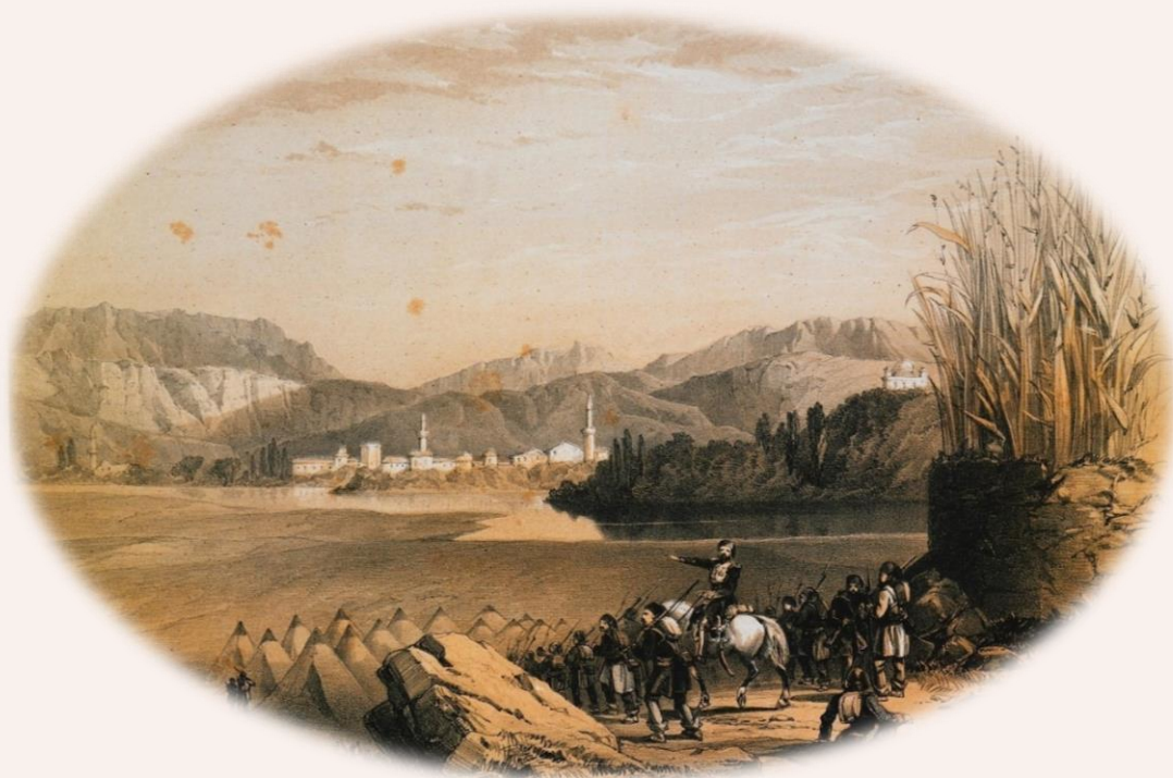
Η Άρτα και ο ποταμός Αραχθός. BERESFORD, George de la Poer, Captain. Twelve Sketches in double tinted Lithography of Scenes in Southern Albania, Λονδίνο, Day and Son, [1855]

αργότερα, το 1880, οι χριστιανοί ανέρχονται σε 6.400, οι μωαμεθανοί σε 800 και σε ισάριθμους με αυτούς οι εβραίοι, (Κοκκίδης, 1880).