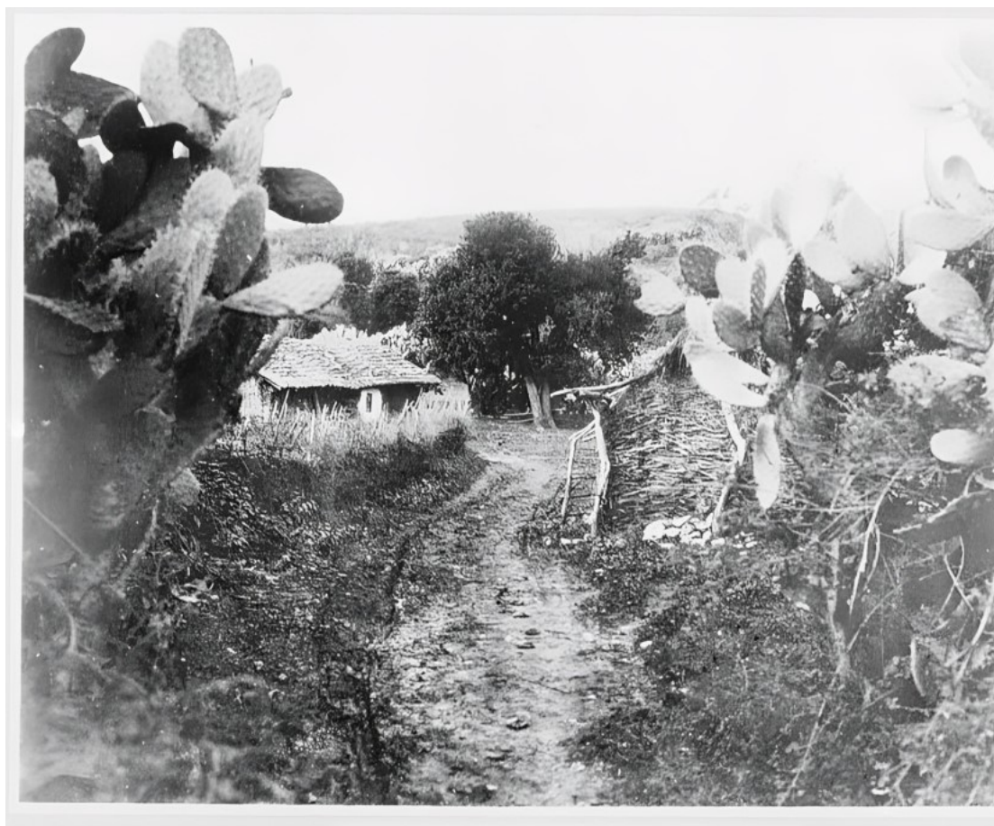
Εικ. 5. Αγροτικό μονοπάτι στη Φιλιπιάδα (Χαμιδιέ/Λούρος), 1912–1913. Οι λιθόκτιστες περιφράξεις, οι κατοικίες και η χαρακτηριστική βλάστηση αναδεικνύουν πτυχές του τοπικού οικιστικού και αγροτικού τοπίου των αρχών του 20ού αιώνα.

Η δημιουργία του Λούρου αποτελεί παράδειγμα σχεδιασμένης ίδρυσης νέου οικισμού, που συνδέεται με διοικητικές και πολιτικές επιλογές της οθωμανικής διοίκησης.