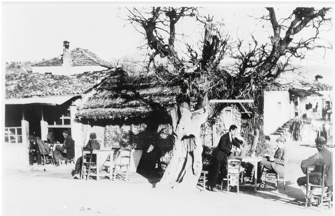
Εικ. 14. Καφενείο στη Φιλιππιάδα (Χαμιδιέ/Λούρος), 1912–1913. Τα καφενεία αποτελούσαν σημαντικούς χώρους κοινωνικής επικοινωνίας και δημόσιας ζωής, αντανακλώντας τον αστικό χαρακτήρα που είχε αποκτήσει η κωμόπολη στις αρχές του 20ού αιώνα.

Η εξέλιξη αυτή παρουσιάζει ιδιαίτερο ενδιαφέρον, καθώς κατά την αρχική σύσταση της κωμόπολης ο πληθυσμός της ήταν αποκλειστικά μουσουλμανικός και ανερχόταν σε 336 άτομα (60 νοικοκυριά). Η σημαντική αύξηση του μουσουλμανικού πληθυσμού —από 336 σε 772, σε συνδυασμό με την παρουσία χριστιανών, υποδηλώνει ότι η πληθυσμιακή σύνθεση της κωμόπολης μεταβλήθηκε σχετικά σύντομα.