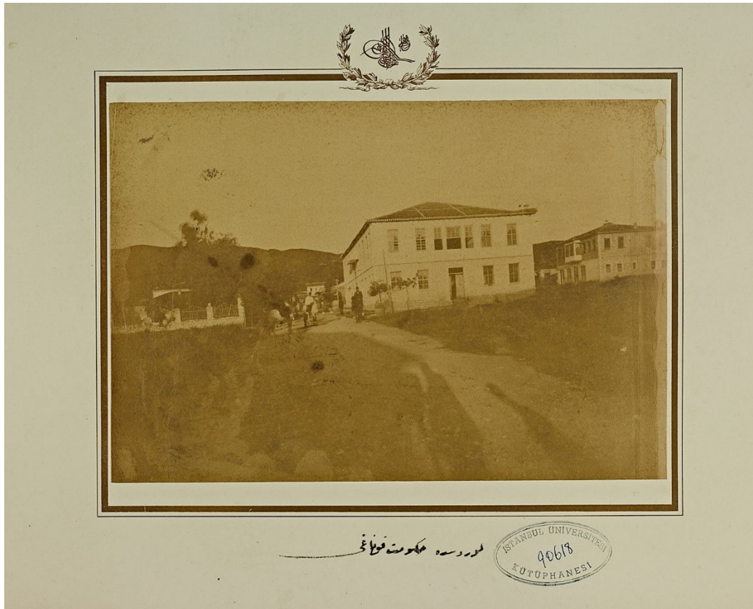
Εικ. 6. . Το κυβερνείο της Χαμιδιέ (Λούρος) στις αρχές του 20ού αιώνα. Η ανέγερση του κτιρίου εντάσσεται στο πρόγραμμα διοικητικής οργάνωσης της νέας κωμόπολης που ιδρύθηκε μετά την παραχώρηση της Άρτας το 1881 και αποτέλεσε την έδρα του καζά Λούρου.