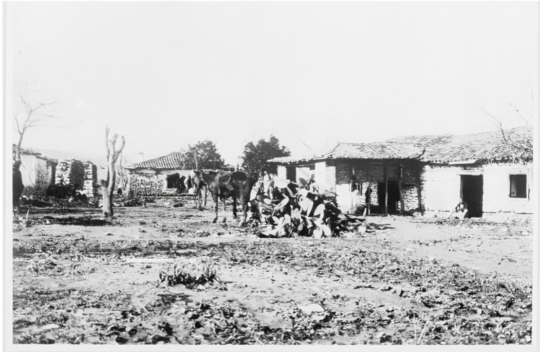
Εικ. 15. Αυλή κατοικιών στη Φιλιπιάδα (Χαμιδιέ/Λούρος), 1912–1913. Η παρουσία ανθρώπων, ζώων και αγροτικών δραστηριοτήτων αναδεικνύει τον στενό δεσμό της κωμόπολης με τον αγροτικό χώρο που συγκροτούσε την οικονομική βάση του καζά Λούρου.