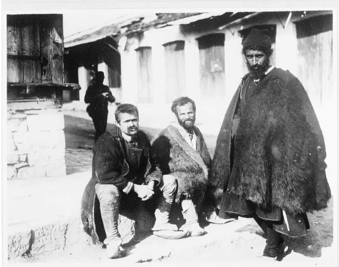
Εικ. 8. Κάτοικοι της Φιλιππιάδας (Χαμιδιέ/Λούρος) κατά την περίοδο των Βαλκανικών Πολέμων (1912–1913). Η φωτογραφία αποτυπώνει μορφές της καθημερινής ζωής και στοιχεία της τοπικής ενδυμασίας των κατοίκων της κωμόπολης.

Η συγκρότηση του Λούρου ως διοικητικού κέντρου συνοδεύτηκε από την ανέγερση βασικών δημόσιων κτιρίων, όπως το διοικητικό κατάστημα (κυβερνείο) και δημοτικές εγκαταστάσεις για τη λειτουργία των τοπικών υπηρεσιών. Η ταχεία δημιουργία αυτών των υποδομών καταδεικνύει τον οργανωμένο χαρακτήρα της ίδρυσης του νέου οικισμού.