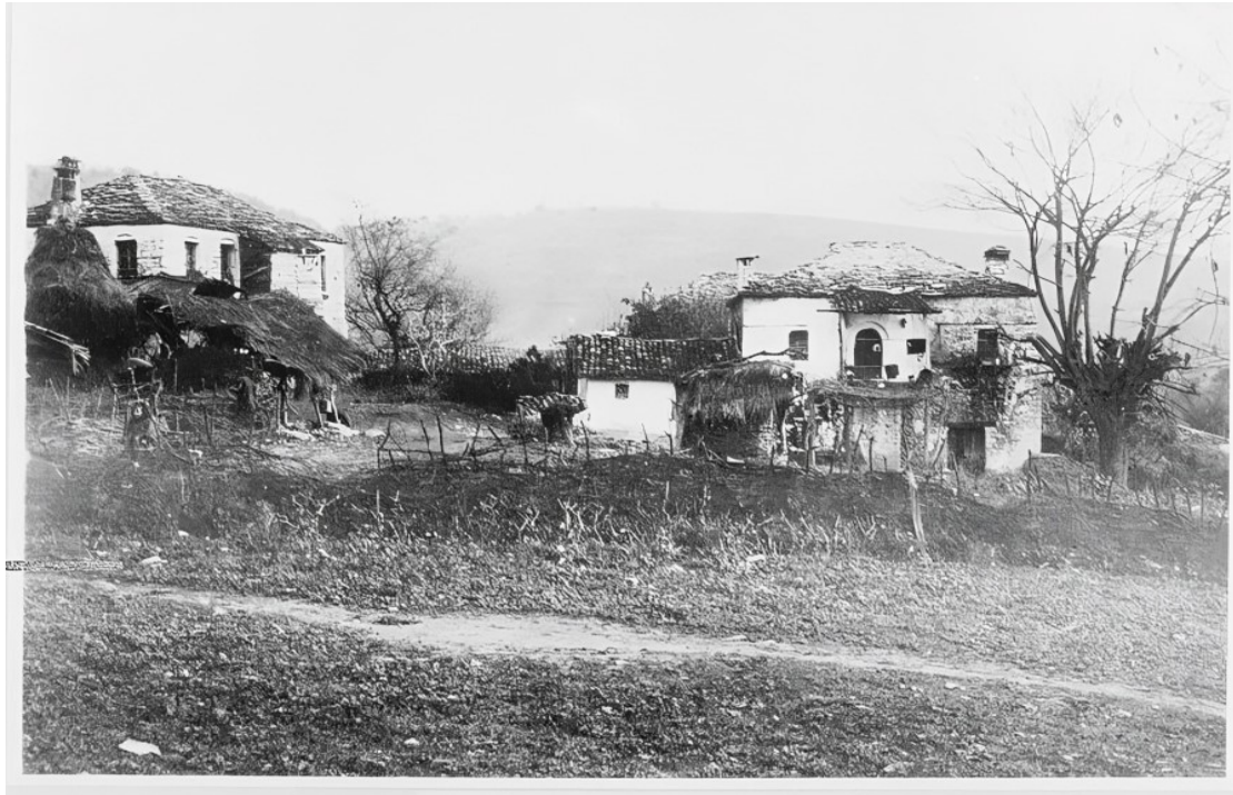
Εικ. 16. Οικιστικό σύνολο στη Φιλιπιάδα (Χαμιδιέ/Λούρος), 1912–1913. Οι κατοικίες και οι αγροτικοί βοηθητικοί χώροι αντανακλούν τον μικτό αστικό και αγροτικό χαρακτήρα της κωμόπολης, η οποία αναπτύχθηκε ως διοικητικό κέντρο του καζά Λούρου μετά το 1881.