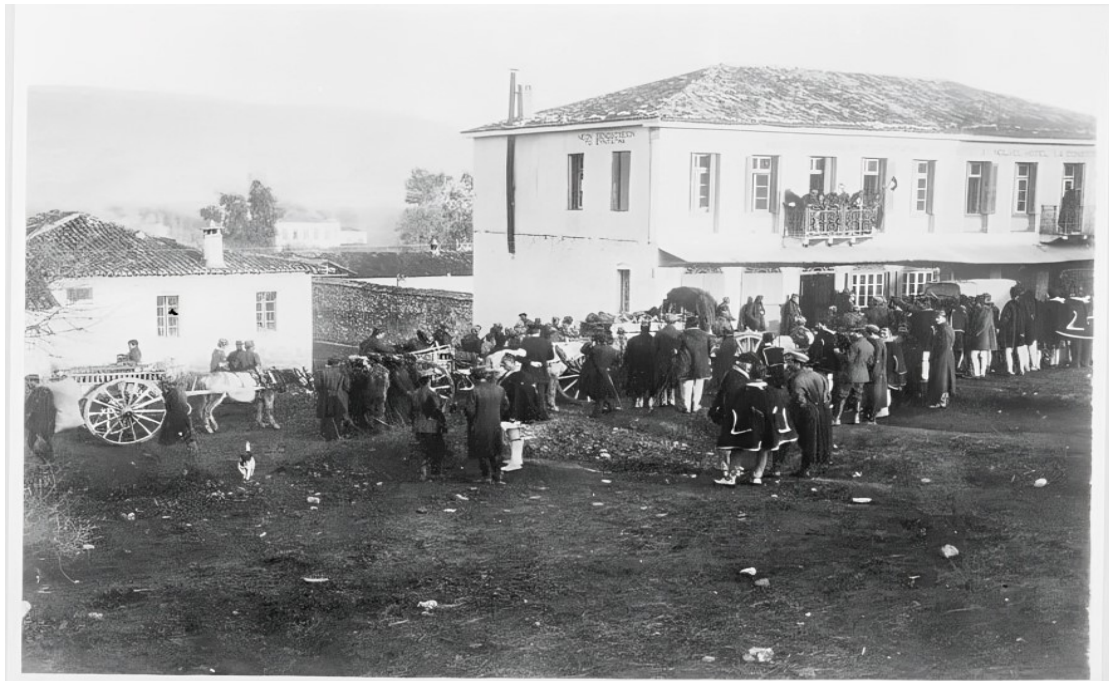
Εικ. 17. Συγκέντρωση κατοίκων μπροστά σε διάφορο κτίριο στη Φιλιπιάδα (Χαμιδιέ/Λούρος) κατά την περίοδο των Βαλκανικών Πολέμων (1912–1913). Η φωτογραφία αποτυπώνει πτυχές της δημόσιας και οικονομικής ζωής της κωμόπολης στις αρχές του 20ού αιώνα.