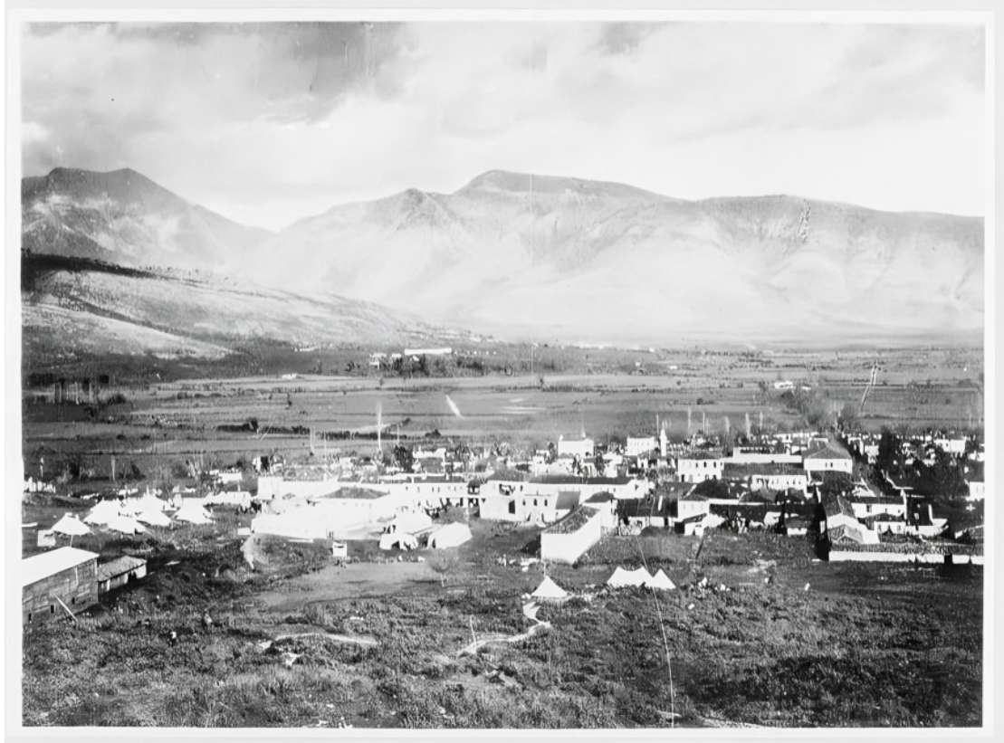
Εικ. 2. Πανοραμική άποψη της κωμόπολης Χαμιδιέ (Λούρος/Φιλιππιάδα) κατά την περίοδο των Βαλκανικών Πολέμων (1912–1913). Διακρίνονται ο οικιστικός πυρήνας και οι προσωρινές στρατιωτικές εγκαταστάσεις στην πεδιάδα της Φιλιππιάδας.