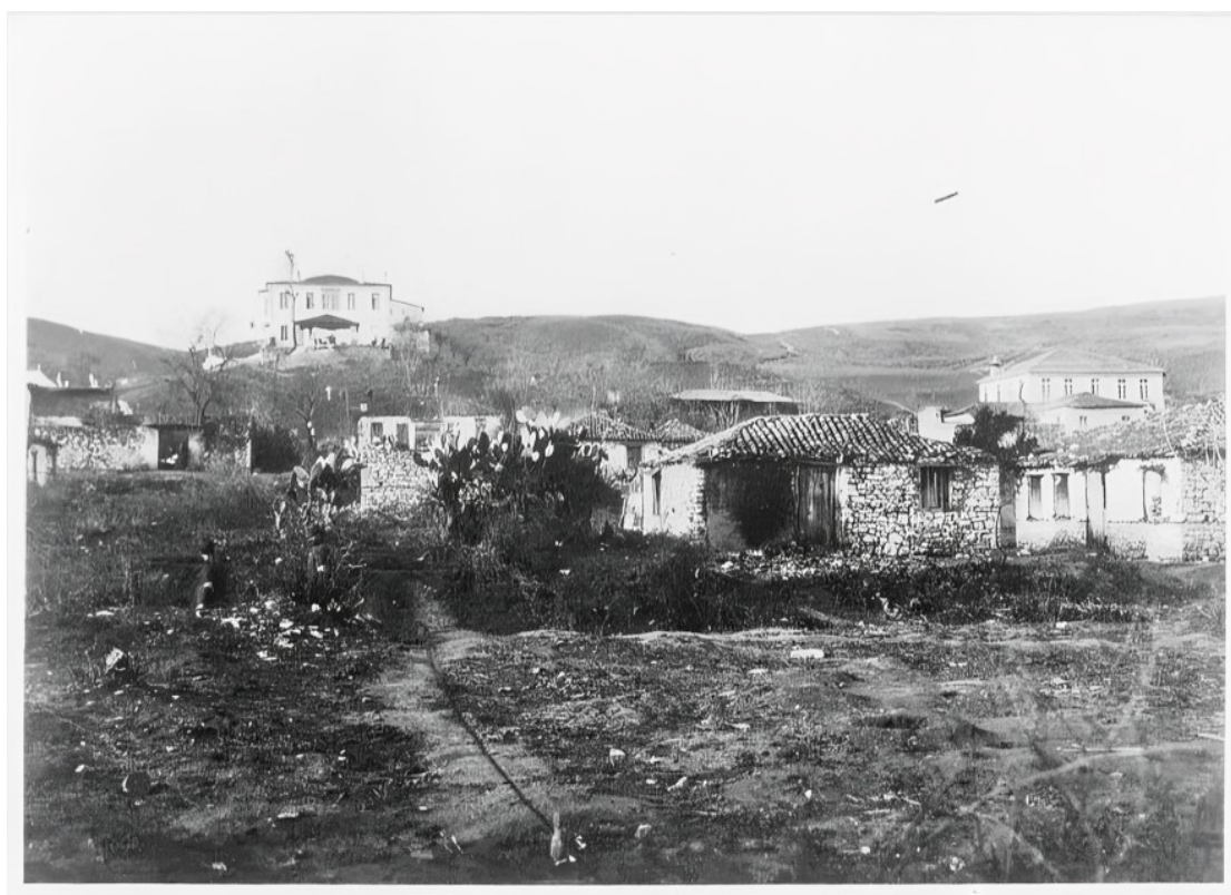
Εικ. 4. Κατοικίες της Φιλιπιάδας (Χαμιδιέ/Λούρος) κατά την περίοδο των Βαλκανικών Πολέμων (1912–1913). Στο ύψωμα διακρίνεται μεγάλο δημόσιο κτίριο, το οποίο έχει ταυτιστεί στη σχετική βιβλιογραφία με το στρατιωτικό νοσοκομείο της περιοχής.

Η ίδρυση της πόλης πραγματοποιήθηκε με επίσημη τελετή στις 6 Σεπτεμβρίου 1881 και εντάσσεται στο ευρύτερο πλαίσιο οικιστικών ανασυγκροτήσεων της Οθωμανικής Αυτοκρατορίας στην Ήπειρο κατά τον 19ο αιώνα.