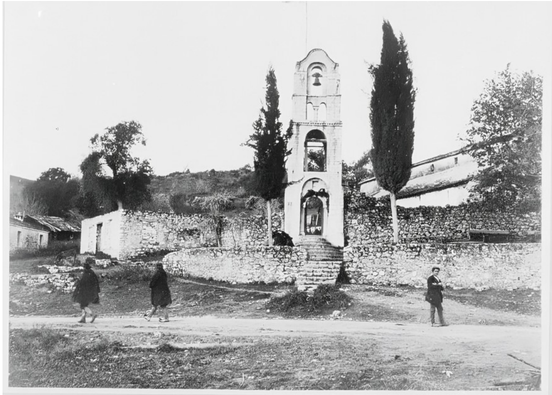
Εικ. 9. Κωδωνοστάσιο χριστιανικού ναού στην περιοχή της Φιλιππιάδας (Χαμιδιέ/Λούρος) κατά την περίοδο των Βαλκανικών Πολέμων (1912–1913). Η φωτογραφία αποτυπώνει τη θρησκευτική παρουσία των χριστιανικών κοινοτήτων στην ευρύτερη περιοχή του καζά Λούρου.

Η καταγραφή αυτή των υποδομών δεν αποτυπώνει μόνο τον αριθμό των εγκαταστάσεων, αλλά αναδεικνύει και τη θρησκευτική, εκπαιδευτική και οικονομική πολυμορφία της περιοχής, καθώς και τη συνύπαρξη διαφορετικών κοινοτήτων στο εσωτερικό του καζά.