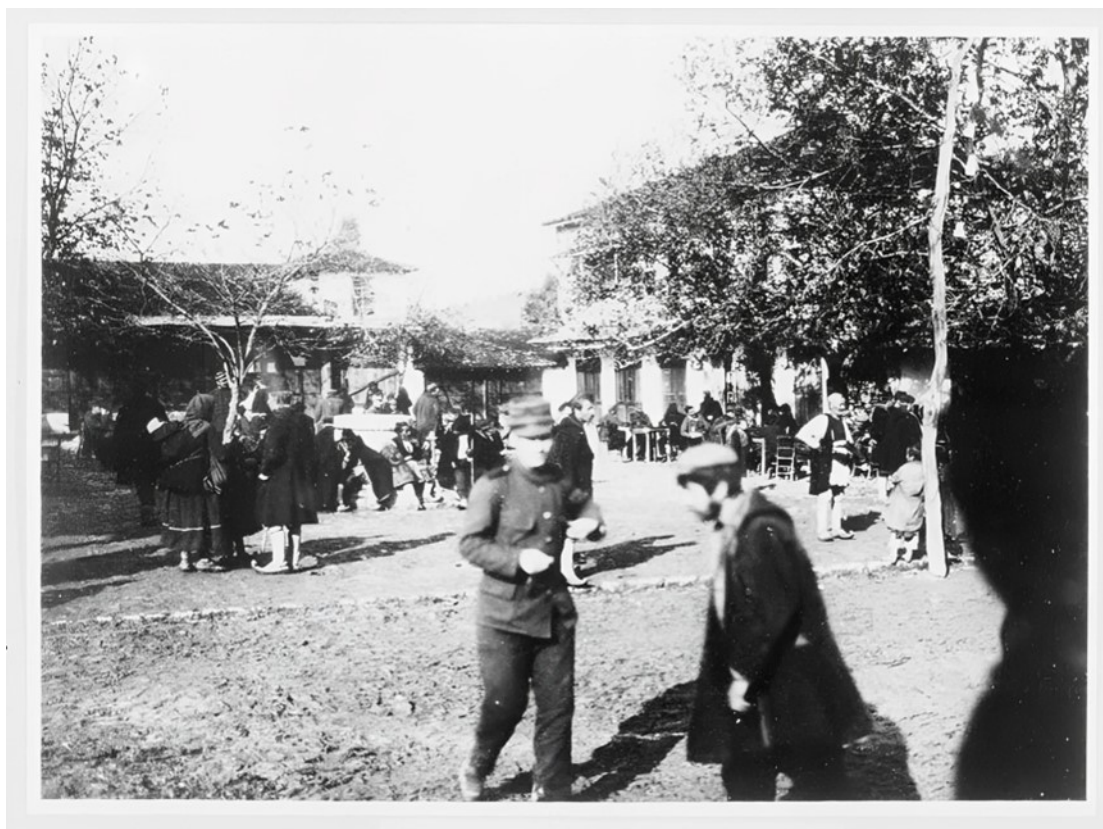
Εικ. 7. Σκηνή από την κεντρική πλατεία της Φιλιππιάδας (Χαμιδιέ/Λούρος) κατά την περίοδο των Βαλκανικών Πολέμων (1912–1913). Η παρουσία κατοίκων και στρατιωτών αποτυπώνει την καθημερινή ζωή και τη δημόσια δραστηριότητα στην κωμόπολη των αρχών του 20ού αιώνα.

διοικητικών δομών κοντά στα σύνορα λειτουργούσε ως μηχανισμός ελέγχου και αποτροπής τέτοιων φαινομένων.