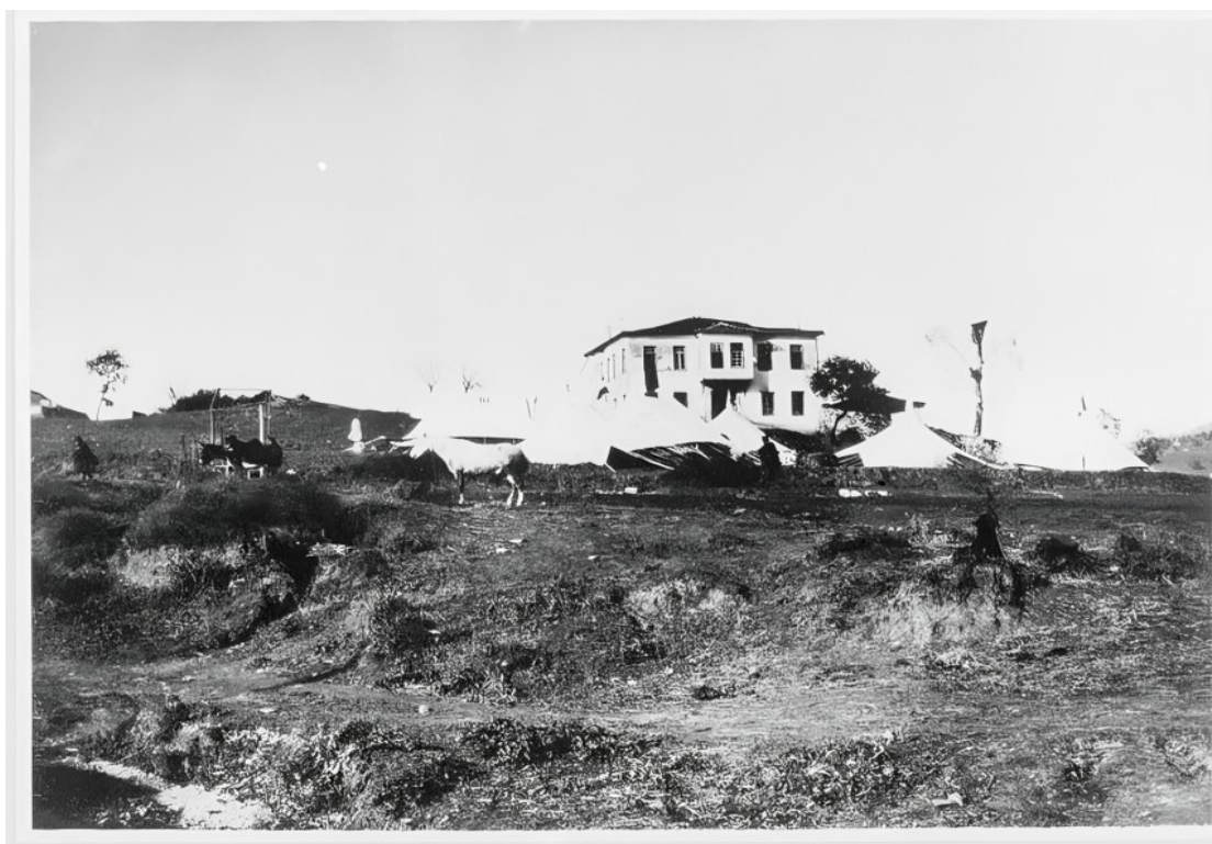
Εικ. 13. Το διοικητικό κτίριο (κυβερνείο) της Χαμιδιέ (Λούρος), περ. 1912–1913. Το κτίριο, το οποίο ανεγέρθηκε στο πλαίσιο της διοικητικής συγκρότησης της νέας κωμόπολης μετά το 1881, χρησιμοποιήθηκε ως στρατιωτικό νοσοκομείο κατά τους Βαλκανικούς Πολέμους.

Η δημογραφική αυτή εικόνα αποτελεί βασικό υπόβαθρο για την κατανόηση των πληθυσμιακών μετακινήσεων που ακολούθησαν, καθώς και της ίδρυσης του Λούρου ως νέου οικιστικού και διοικητικού κέντρου.