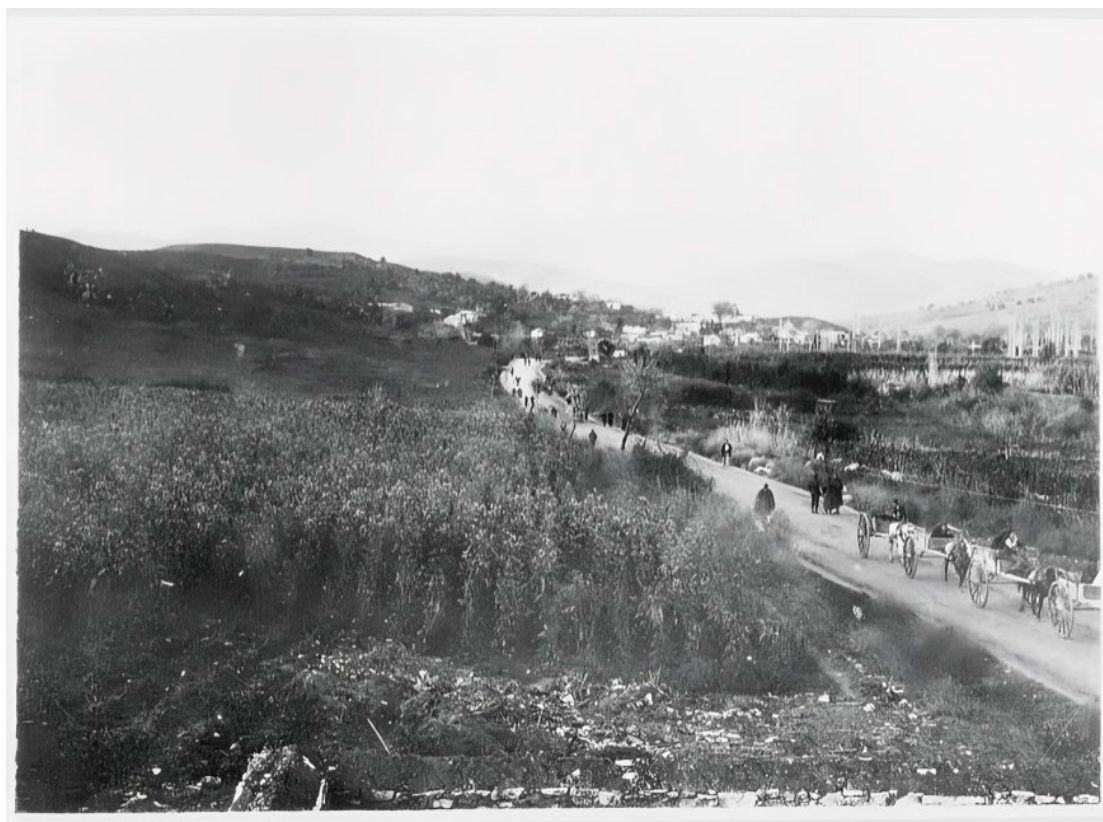
Εικ. 3. Φυτεία καπνού (Tabakplantage) στην περιοχή της Φιλιπιάδας (Χαμιδιέ/Λούρος) κατά την περίοδο των Βαλκανικών Πολέμων (1912–1913). Η φωτογραφία αποτυπώνει τμήμα του οδικού δικτύου και της αγροτικής ζώνης που περιέβαλλε την κωμόπολη.

Άρτας, η οποία όμως βρισκόταν πλέον εντός του ελληνικού κράτους. Για την αντιμετώπιση του προβλήματος αυτού ιδρύθηκε νέα μητρόπολη στην Πρέβεζα, προκειμένου να εξυπηρετηθούν οι θρησκευτικές ανάγκες των χριστιανικών πληθυσμών της οθωμανικής πλευράς.