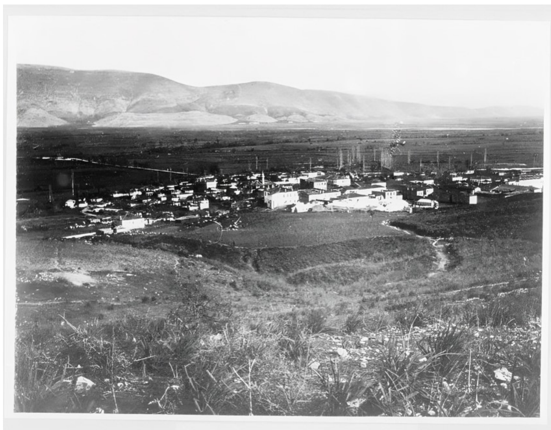
Εικ. 1. Οικιστικός πυρήνας της Χαμιδιέ (Λούρος) στις αρχές του 20ού αιώνα. Η φωτογραφία αποτυπώνει τη χωροθέτηση της κωμόπολης μέσα στον αγροτικό χώρο που συγκροτούσε την ενδοχώρα του καζά Λούρου. Περίοδος Βαλκανικών Πολέμων (1912–1913).

Με την παραχώρηση της Άρτας, το νέο σύνορο μεταξύ των δύο κρατών καθορίστηκε κατά μήκος του ποταμού Άραχθου. Η μεταβολή αυτή είχε άμεσες διοικητικές και κοινωνικές συνέπειες, καθώς οδήγησε σε αναδιάταξη πληθυσμών και διοικητικών δομών στην περιοχή.