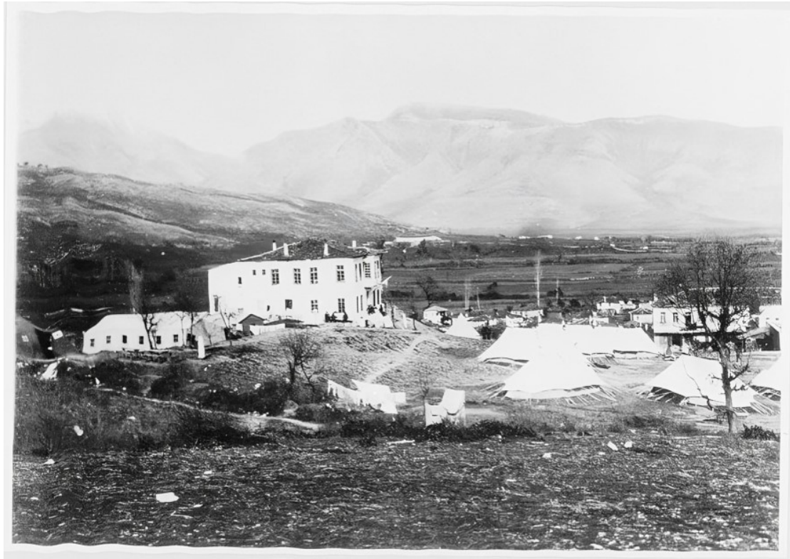
Εικ. 18. Άποψη του διοικητικού κέντρου της Χαμιδιέ (Λούρος) κατά τους Βαλκανικούς Πολέμους (1912–1913). Στο προσκήνιο διακρίνονται στρατιωτικές σκηνές, ενώ στο ύψωμα δεσπόζει το οθωμανικό διοικητήριο, το οποίο χρησιμοποιήθηκε ως στρατιωτικό νοσοκομείο.

Τα στοιχεία της απογραφής του 1915 για την υποδιοίκηση Φιλιπιάδος παρουσιάζονται στον ακόλουθο πίνακα: