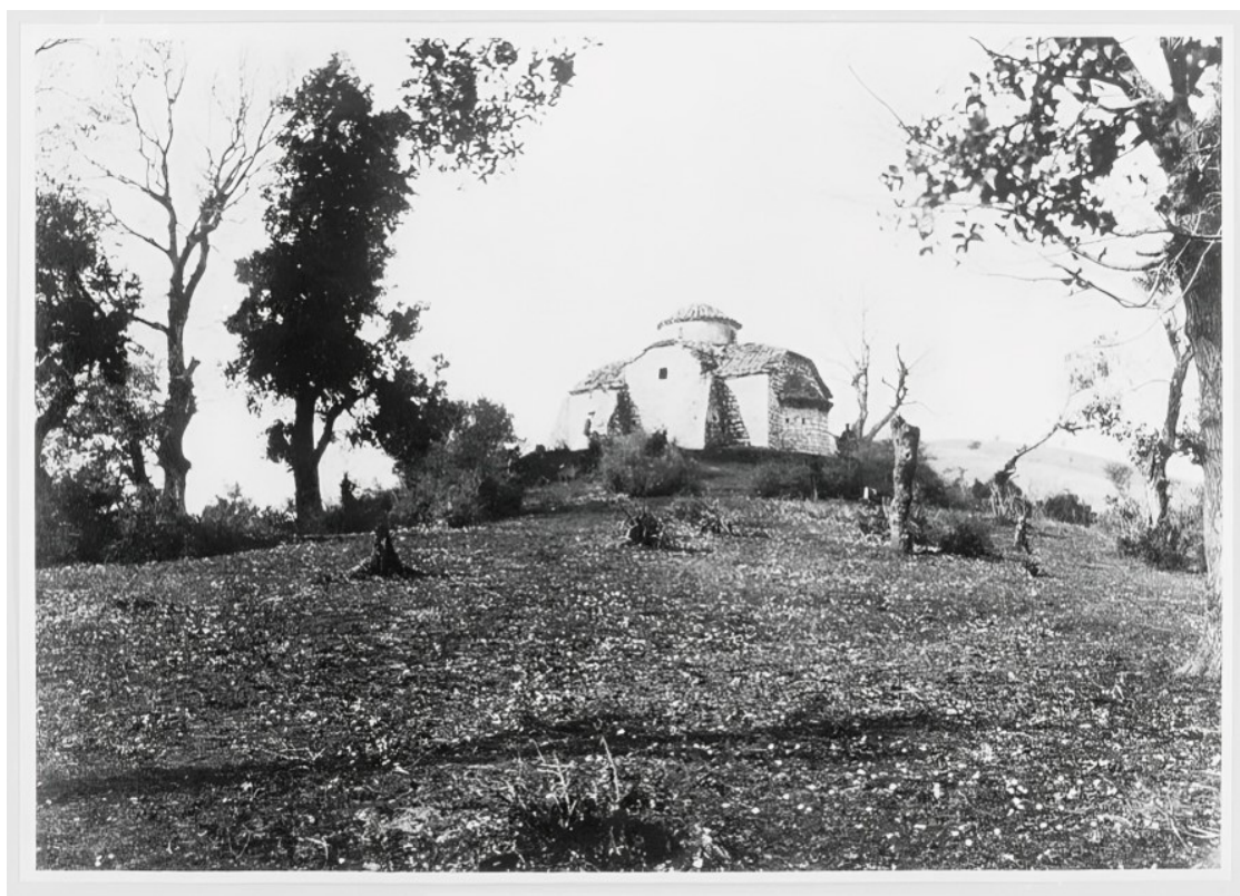
Εικ. 19. Ο ναός του Προφήτη Ηλία στην ευρύτερη περιοχή της Φιλιππιάδας (Χαμιδιά/Λούρος), 1912–1913. Η φωτογραφία τεκμηριώνει τη χριστιανική θρησκευτική παρουσία στην ύπαιθρο του καζά Λούρου κατά την ύστερη οθωμανική περίοδο.

Η ανάλυση της δημογραφικής και διοικητικής εξέλιξης της περιοχής του Λούρου καταδεικνύει ότι η ίδρυση της κωμόπολης συνδέθηκε άμεσα με τις ευρύτερες γεωπολιτικές και διοικητικές μεταβολές που προκάλεσε η παραχώρηση της Άρτας στην Ελλάδα. Ο Λούρος συγκροτήθηκε ως νέος διοικητικός και οικιστικός πυρήνας, με σκοπό την εγκατάσταση μετακινούμενων πληθυσμών και τη διαχείριση της συνοριακής ζώνης.