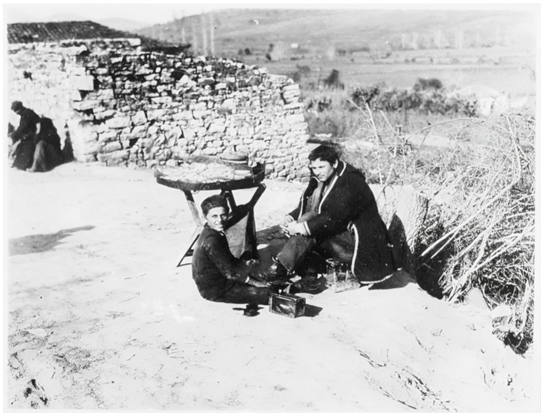
Εικ. 11. Λούστρος παπουτσιών στη Φιλιπιάδα (Χαμιδιά/Λούρος), 1912–1913. Η εικόνα αποτυπώνει όψεις της καθημερινότητας και της επαγγελματικής δραστηριότητας των κατοίκων της κωμόπολης.

Η διαφοροποίηση αυτή μεταξύ κωμόπολης και υπαίθρου είναι ιδιαίτερα χαρακτηριστική: η κωμόπολη λειτουργεί ως χώρος συγκέντρωσης μουσουλμανικού πληθυσμού, ενώ η ύπαιθρος διατηρεί την έντονα χριστιανική της φυσιογνωμία.